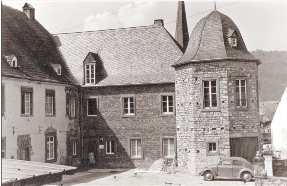
Erneuerter Westflügel mit angebautem Achteckturm um 1950

lieu des travaux de remise en état qui s'efforcent de faire réapparaître l'aspect et l'aménagement des 17 et 18 siècles. De nombreux éléments historiques sont retrouvés, par exemple la grande cuisine avec le fumoir porté par deux piliers, la taque et le four en pierre. Au rez-de-chaussée une grande salle (probablement salle de justice) équipée d'une cheminée avec une ouverture en plein cintre. Plusieurs inscriptions du 17e s. se rapportent aux travaux réalisés par les différents propriétaires.