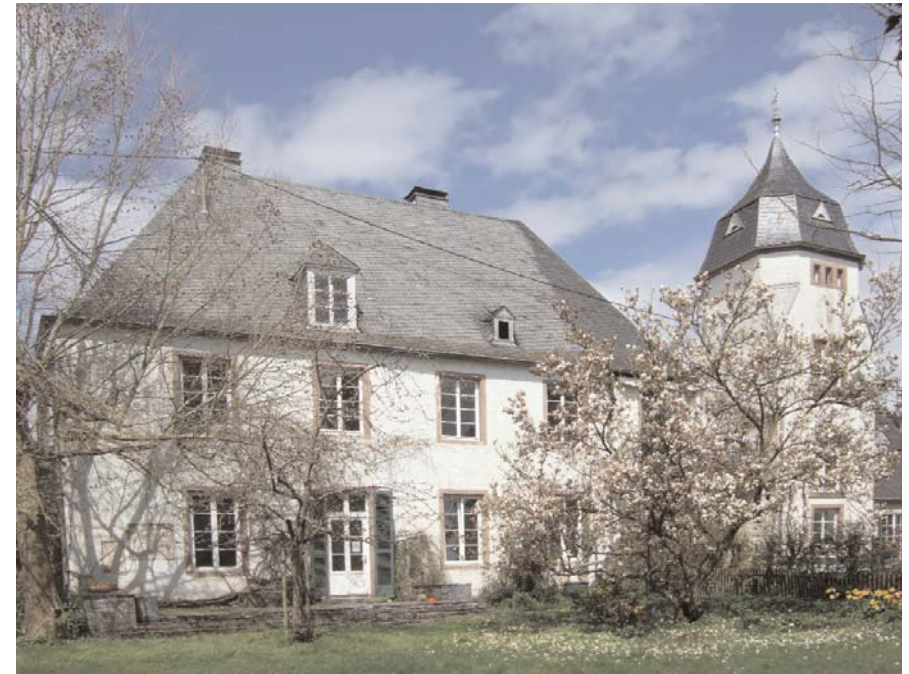
Gartenseite, rechts der Turm von 1906