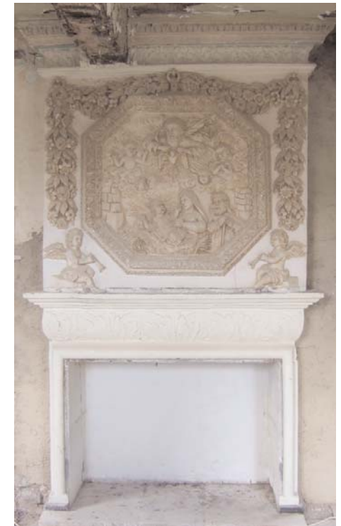
Prachtvoller Kaminaufsatz: Geburt Jesu, mit Gott Vater, dem Hl. Geist und jublierenden Engeln.