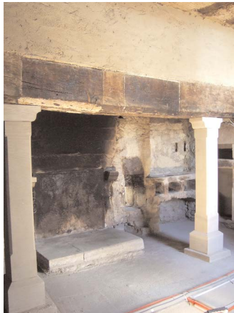
Küche mit großer Esse, Herd mit „Potager“ zum Wärmen und Backofen

durch das Datum 1734 auf der Takenplatte der großen Küche belegt. 1799 gelangt der Besitz durch Erbschaft an die Grafen de Saintignon, der letzte Graf lässt 1906 den Turm auf der Gartenseite errichten. Seit 1916 in wechselndem Privatbesitz wird das Haus nach 1950 grundlegend saniert und im Geschmack der Zeit ausgebaut. An den erneuerten westlichen Seitenflügel wurde ein achteckiger Turm angefügt, 1974 entstand an Stelle der drei östlichen Achsen ein eingeschossiger, angepasster Neubau im Landhausstil (Architekt Emmerich, Bitburg). Seit 2007 finden umfangreiche Sanierungs- und Instandsetzungsarbeiten statt, deren Ziel die Wiederherstellung der historischen Raumfolge